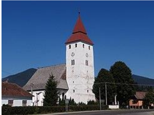
A Szent Mihály templom